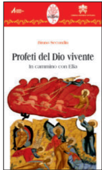
Coll. "Rotem" n. 19 Pp. 150. 14,00

I 22 libri della Collana "Rotem" (Ed. Messaggero), frutto della nostra esperienza, più altri, raccolgono i testi dei commenti ai brani biblici fatti negli incontri di lectio divina . Il Poster (Ed. LDC) e il sussidio (in 8 lingue) sono strumenti molto utili per i gruppi e le comunità. Informazioni sul contenuto dei libri al sito: www.lectiodivina.it . Libri e poster si possono comprare in tutte le librerie cattoliche.