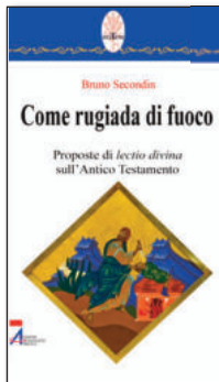
Coll. "Rotem" n. 21. Pp. 173. € 15,00