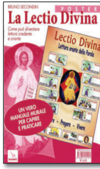
Poster (cm 70x100) + fasc. pp.16 - € 4,00