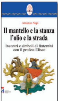
Coll. "Rotem" n. 20. Pp. 274. € 19,00