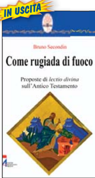
Coll. "Rotem" n. 21. Pp. 173. € 15,00