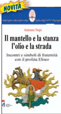
Coll. "Rotem" n. 20. Pp. 274. € 19,00