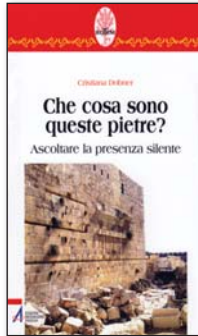
Coll. "Rotem" n. 18. Pp. 218. € 17,00

I 21 libri della Collana "Rotem" (Ed. Messaggero), frutto della nostra esperienza, più altri, raccolgono i testi dei commenti ai brani biblici fatti negli incontri di lectio divina . Il Poster (Ed. LDC) e il sussidio (in 8 lingue) sono strumenti molto utili per i gruppi e le comunità. Informazioni sul contenuto dei libri al sito: www.lectiodivina.it . Libri e poster si possono comprare in tutte le librerie cattoliche.