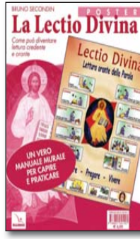
Poster (cm 70x100) + fasc. pp.16 - € 4,00